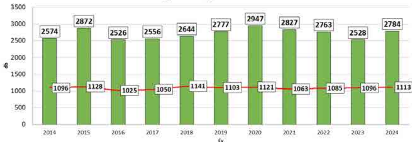
Megtalált nagyvad mennyisége és hajsza aránya Magyar Vérebe Egylet 2014-2024.