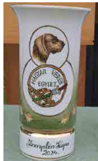
A Hollóházi porcelán Zemplén kupa

tradíciókra épülő, jelentős erkölcsi és anyagi hasznot hozó tevékenységet a környékbeli vadászok is megismernék és ami fontosabb, saját hasznukra intenzíven gyakorolnák, elsajátítanák! A győztes fotója hátsó borító belső oldalán) Összességében újfent egy munkás és eredményes évet tudhatunk magunk mögött, az MVE létszámában és teljesítményében növekszik, de néhány korábban megszokott dolgunkon változtatnunk kell ahhoz, hogy a zavartalan működésünk továbbra is biztosított legyen, ezért 2025 év közgyűlésen néhány szabályzatmódosítási javaslatot fogunk tagjaink elé terjeszteni.